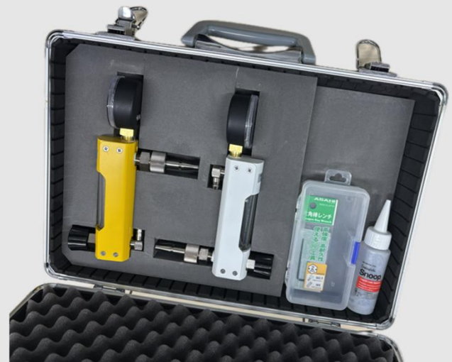
セット品(アルミケース入)